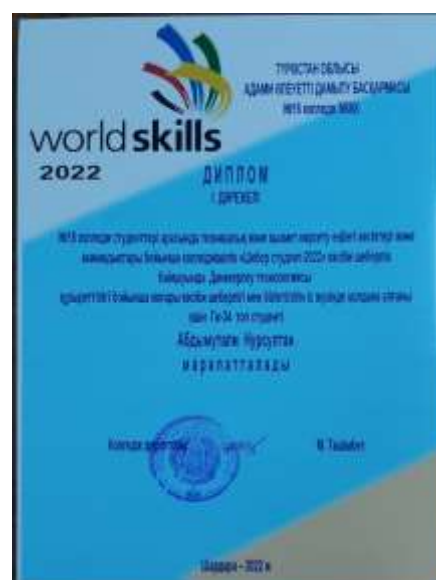
«Шебер студент-2022» байқауының көрініс Дәнеркерлеу технологиясы